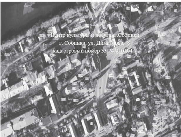
Схема расположения территории для реализации инициативного проекта «Память поколений»

Приложение к постановлению администрации Собинского муниципального округа от 11.02.2025 № 218