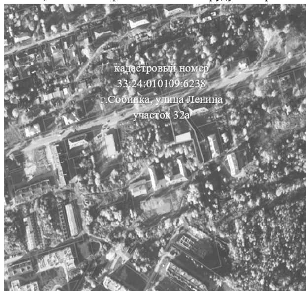
Схема расположения территории для реализации инициативного проекта «Готов к труду и обороне»

Приложение к постановлению администрации Собинского муниципального округа от 11.02.2025 № 220