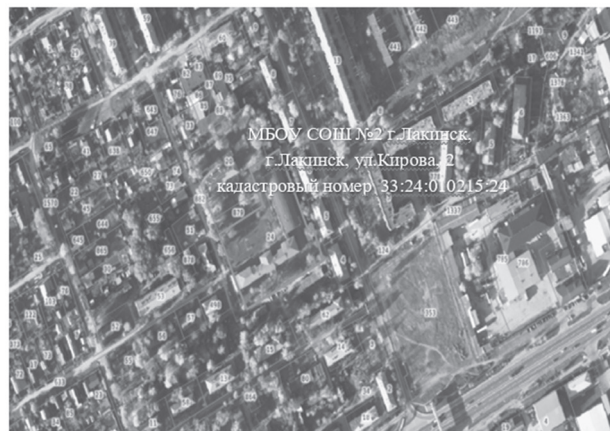
Схема расположения территории для реализации инициативного проекта «Актовый зал – площадка для общения и творчества»

Приложение к постановлению администрации Собинского муниципального округа от 11.02.2025 № 215