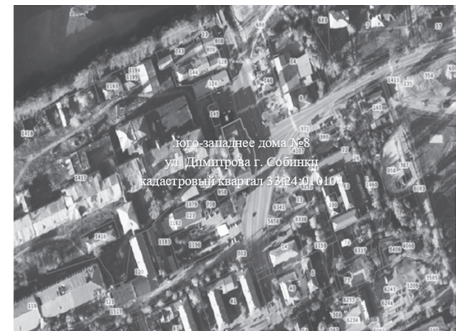
Схема расположения территории для реализации инициативного

Приложение к постановлению администрации Собинского муниципального округа от 11.02.2025 № 221