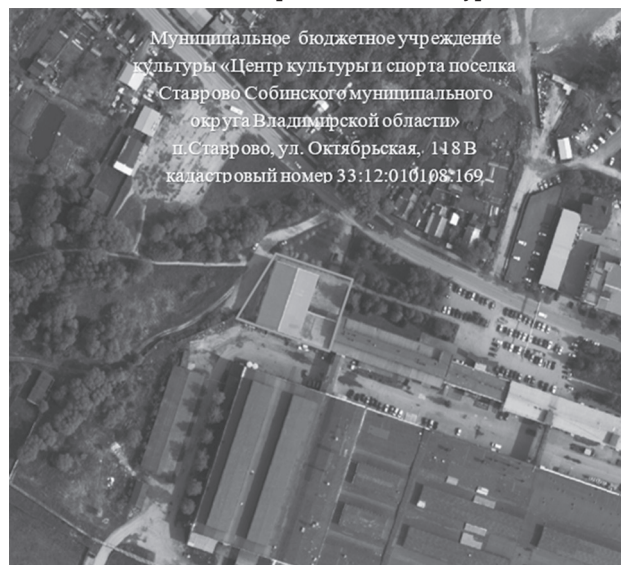
Схема расположения территории для реализации инициативного проекта «Летят журавли»

Приложение к постановлению администрации Собинского муниципального округа от 11.02.2025 № 219