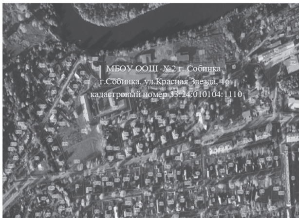
Схема расположения территории для реализации инициативного проекта «Спортивный зал – территория здоровья»

Приложение к постановлению администрации Собинского муниципального округа от 11.02.2025 № 214