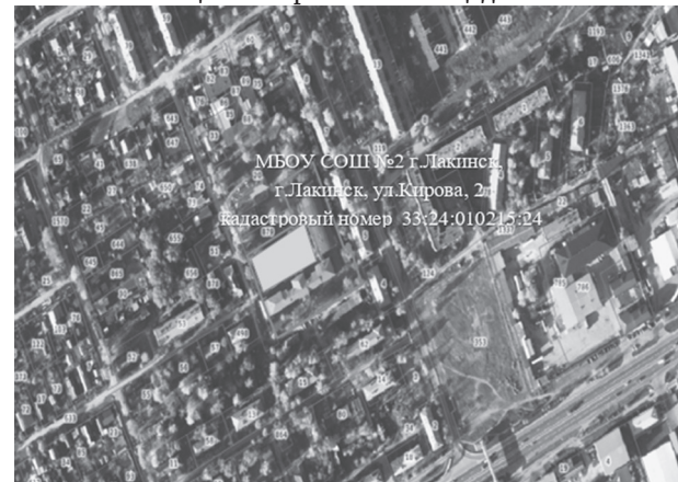
Схема расположения территории для реализации инициативного проекта «Благоустройство пришкольной территории с органи- зацией спортивной площадки»